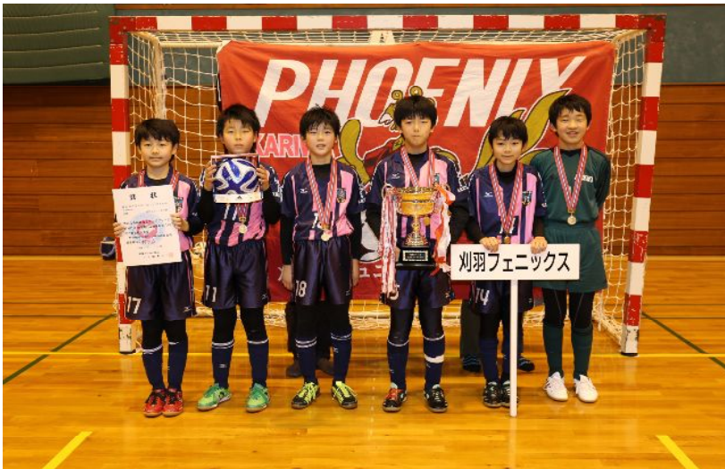
優勝 刈羽フェニックス