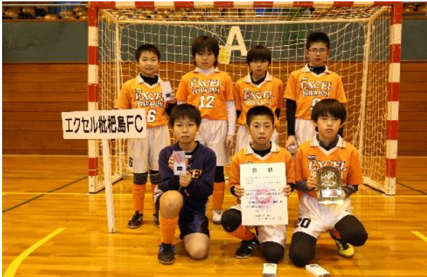
準優勝 エクセル枇杷島