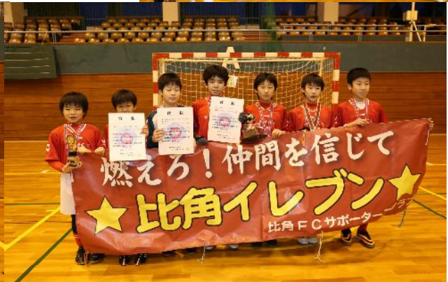
第三位 比角フットボールクラブ